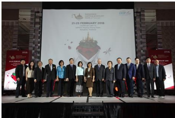
La presentazione dell'edizione 2018 della Bangkok Gems&Jewelry Fair

Fino al 25 febbraio gioielli, pietre preziose e macchinari alla 61esima edizione della rassegna. In calendario mostre, sfilate e seminari